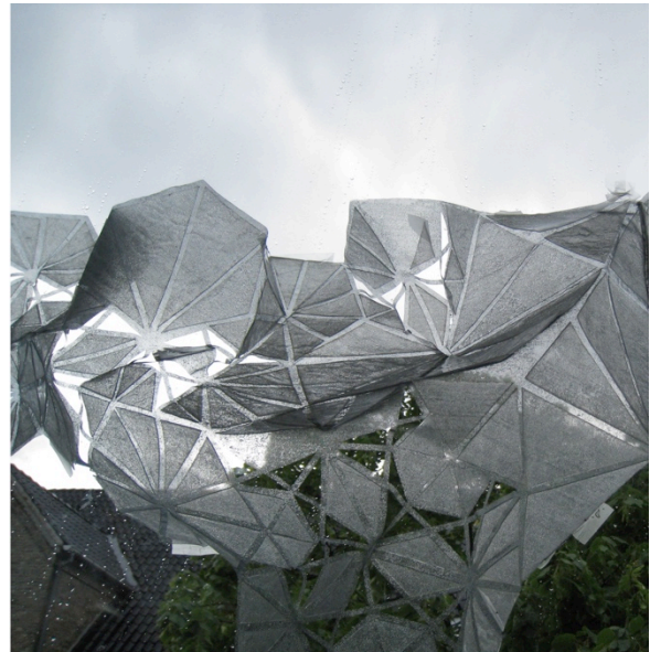
Ice-fern , 2009, détail, sculpture de fenêtre par Aurélie Mossé, Mette Ramsgaard Thomsen, Karin Bech.

Seront plus particulièrement privilégiés des candidat•e•s souhaitant développer une thèse doctorale ancrée dans la pratique du design s'inscrivant dans les thématiques du groupe et notamment autour des sujets suivants : biodesign, textiles intelligents, ainsi que matériaux précieux et semi précieux en nouvelles mises en formes destinés au luxe, à la mode et au haut de gamme à la française.