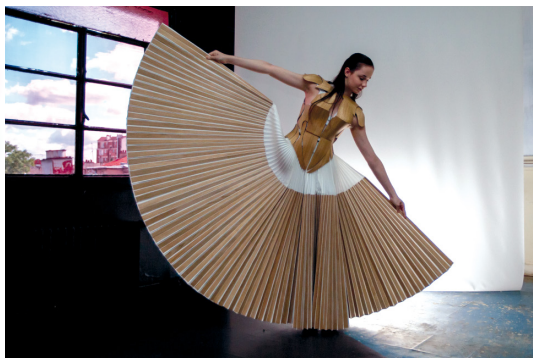
Élodie Le Prunennec

L'École Nationale de Mode et Matière ambitionne de former les talents créatifs de la mode et du textile de demain.