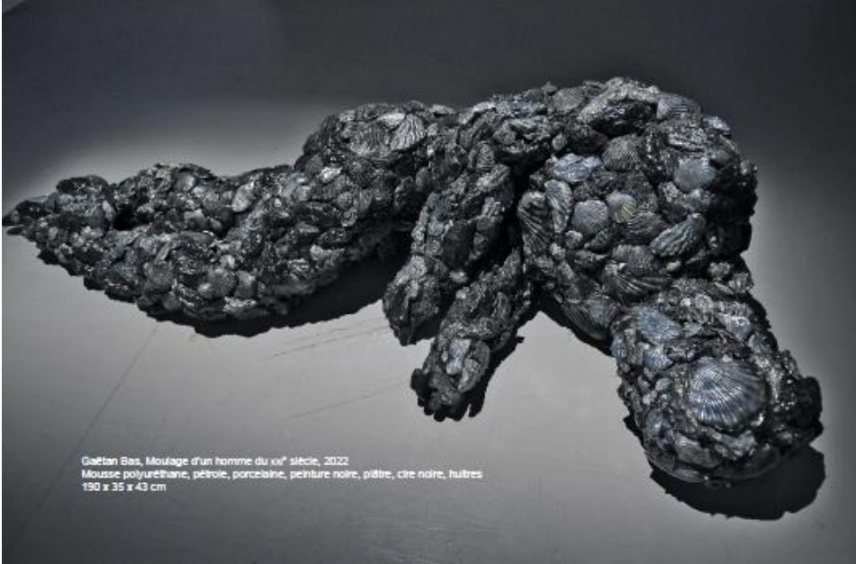
Gaëtan Bas, Moulage d'un homme du xix e siècle, 2022 Mousse polyuréthane, pétrole, porcelaine, peinture noire, plâtre, cire noire, huîtres 190 x 35 x 43 cm