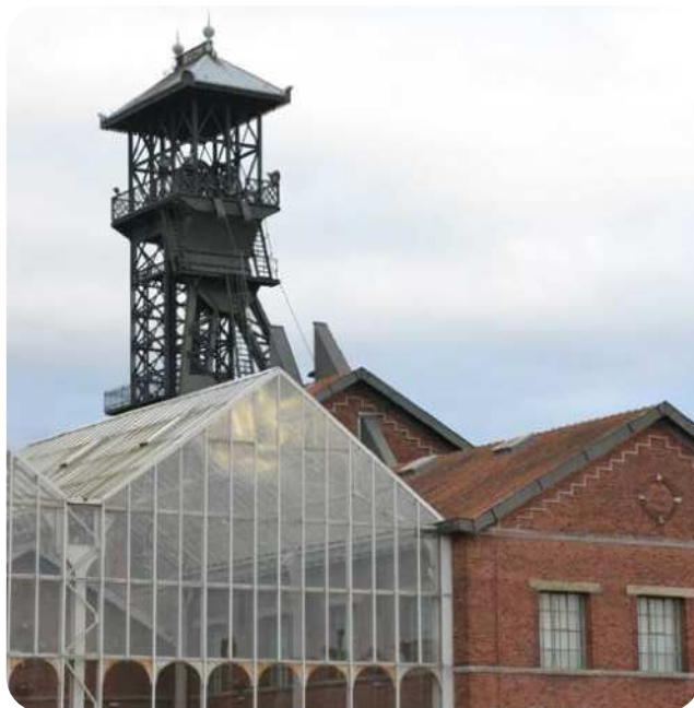
Centre historique minier de Lewarde