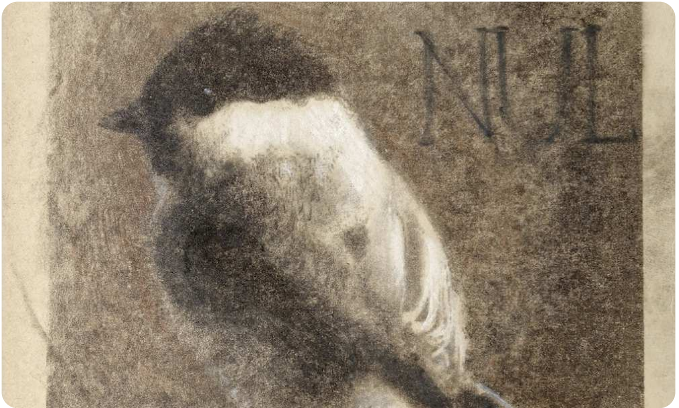
Jean-Luc Verina, Nul