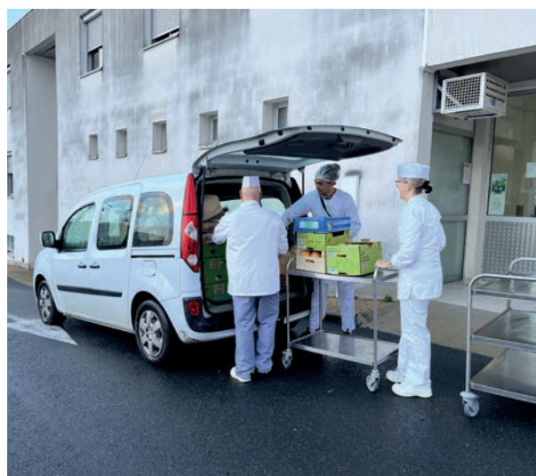
Mobilité. Extension du service de transport scolaire au transport de salariés et de denrées alimentaires, 2022-23