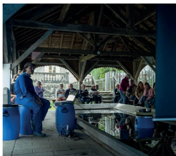
Eau et patrimoine. Fédérer 6 communes et leurs habitantes et habitants autour du patrimoine des lavoirs pour en faire des espaces vivants et partagés et traiter les enjeux de l'eau, 2021-22