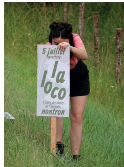
Alimentation ; Genre et ruralité ; Identité territoriale. Activation d'un espace transitoire situé dans l'ancienne gare de Nontron, convertie en nouvel épicerie des initiatives locales, 2023-24