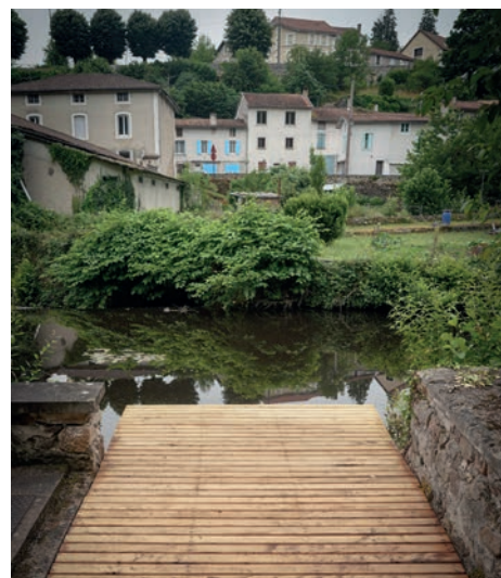
Identité territoriale. Mobilier rural en châtaignier local pour la ville de Nontron dans le quartier du Faubourg Magnac, 2022-23. Julie Eymery / Rose Schwab