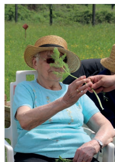
Alimentation et environnement. Faire réapparaître des plantes sauvages comestibles dans l'espace public, dans la conscience collective et dans les assiettes, 2021-22