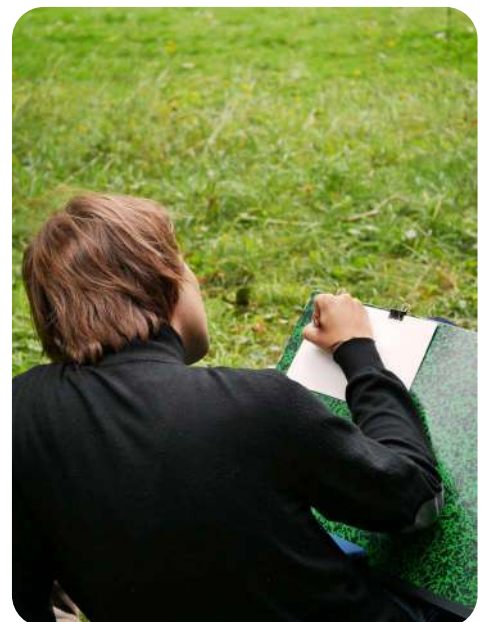
Voyage d'étude 2024