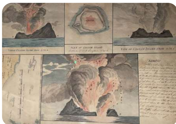
Clément Cogitore - Ferdinanda, l'île éphémère (exposition Mucem)