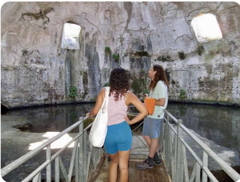
Voyage à Naples 2025