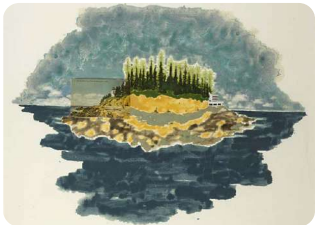
Pacific Palisades ©Blaise Drummond

Blaise Drummond, peintre et graveur anglais vit et travaille dans le comté de Longford en Irlande. Sa pratique s'articule autour des concepts du monde naturel, du paysage et de sa représentation, de l'architecture et du design, et se déploie sous forme de peintures, de dessins et de sculptures/installations.