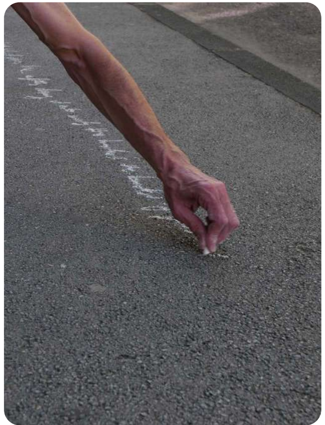
Ulysses, a long way