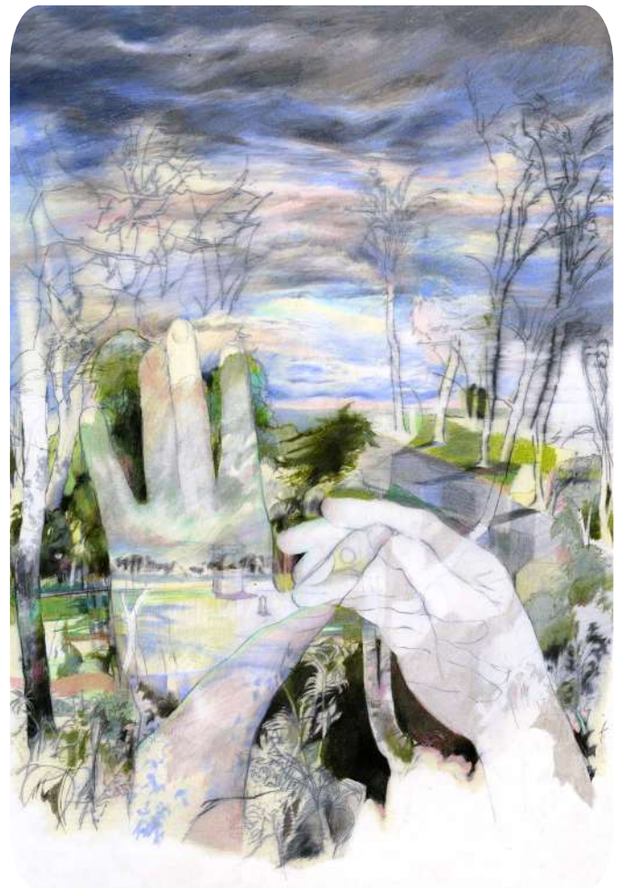
Dans l'humeur vitrée © Salomé Pérez

L'exposition réunira étudiants et jeunes diplômés de 3 prestigieuses écoles soutenues par la maison Hermès.