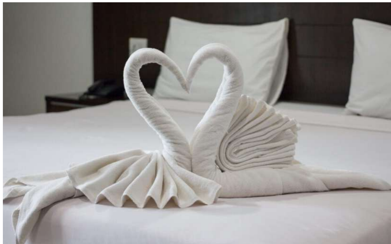
Exemple de Towel art puisé sur Internet

On sait tous que les femmes effectuent la majorité de ce travail. (Oui, c'est un travail puisque, clairement, ce n'est pas un loisir, et qu'en plus on peut payer quelqu'un d'autre pour le faire.) Les médias égrènent régulièrement les derniers chiffres sur le sujet en provoquant un intérêt qui avoisine le zéro absolu, mâtiné de hochements de tête du genre « oh oui, c'est bien embêtant ». On réagit tous comme si ces chiffres ne concernaient aucun d'entre nous en particulier et qu'il s'agissait d'un simple déséquilibre pas bien grave, ça va aller en s'arrangeant, il faut laisser du temps au temps, de toute façon je n'ai entendu que d'une oreille parce que je vidais la machine.