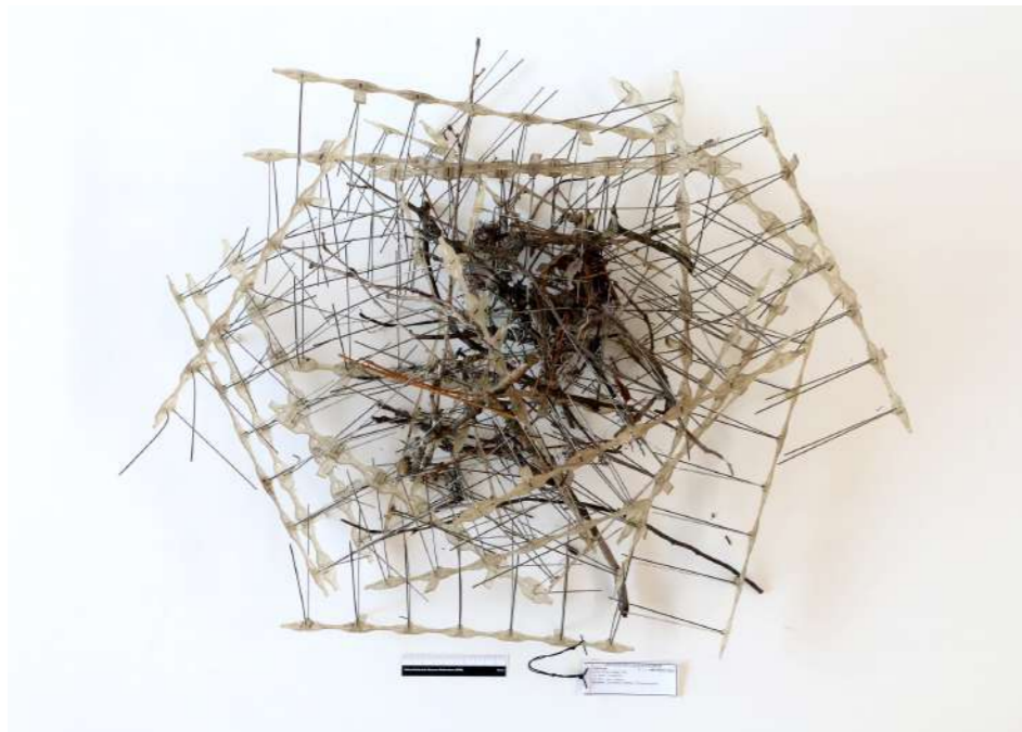
Pios anti-pigeons utilisés par des corbeaux et des pies pour construire leurs nids.

C'est nous les déménageurs de pianos Des Steinway, des Pleyel et de Gaveau Du tintement des pourboires économiques Nous on connaît la musique