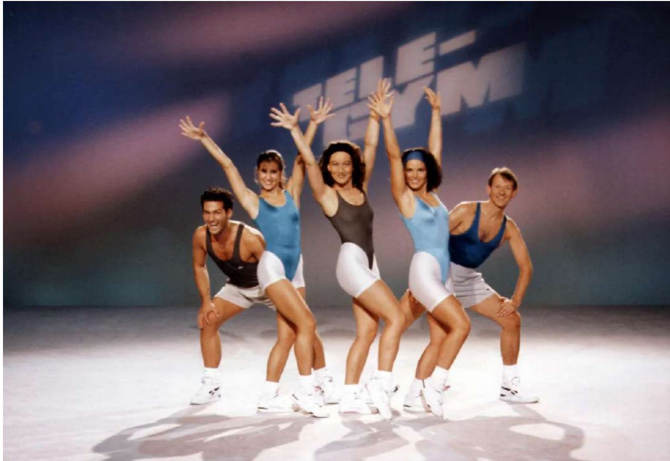
TELE-GYM, émission d'aérobic à la télévision allemande, 1991.

Épreuve de production artistique Durée de l'épreuve: 4 heures