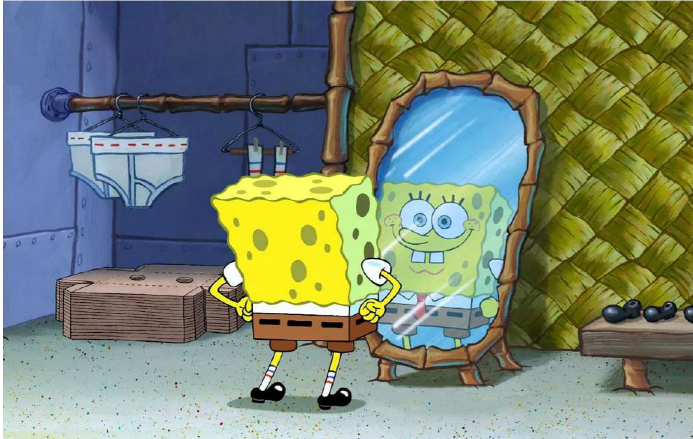
Bob L'Éponge de Stephen Hillenburg

Épreuve de production artistique Durée de l'épreuve: 4 heures