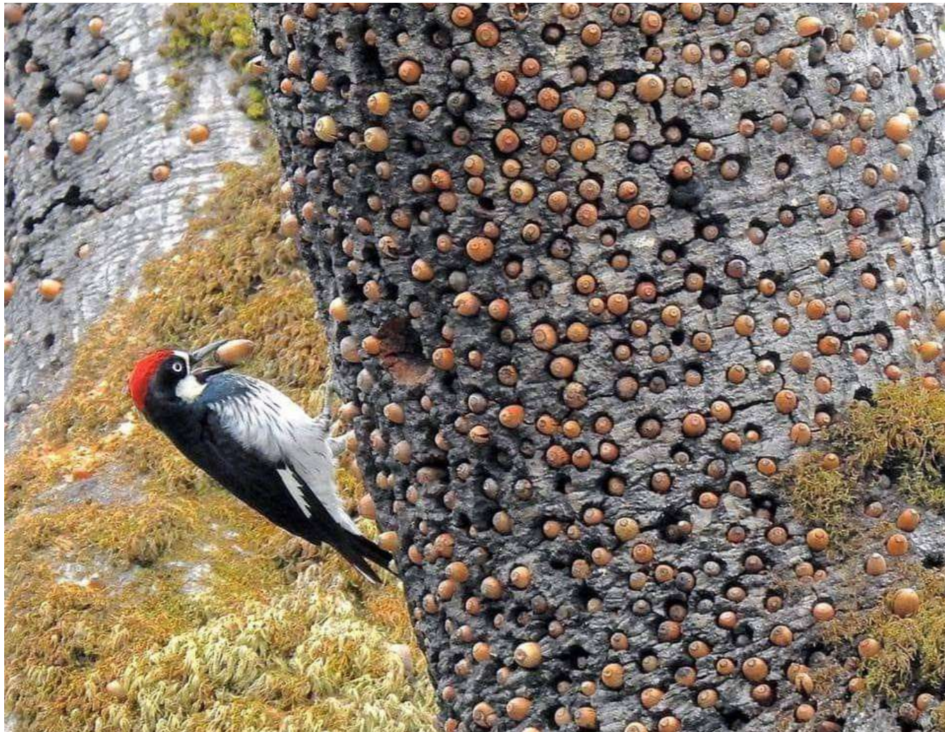
Photographie amateur d'un pic glandivore ( Melanerpes formicivorus )

Épreuve de production artistique Durée de l'épreuve: 4 heures