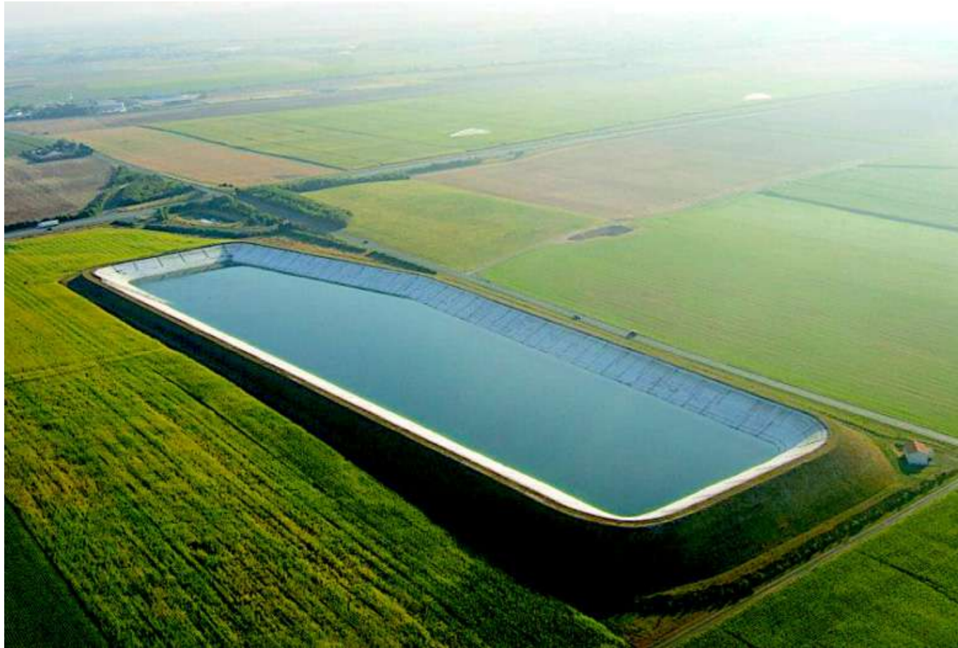
La bassine de Mauzé-sur-le-Mignon (Deux-Sèvres), le 6 mars 2023.

Big Data est une masse volumineuse et véloce. Si elle se composait de livres, elle napperait tout le territoire américain et grimperait sur cinquante-deux étages. Si elle se composait de CD, on en verrait cinq colonnes monter jusqu'à la Lune. Certains parlent du déluge de données face auquel il faut dresser une arche, au moins le savoir-faire d'un Noé ou d'un Thésée pour frayer son chemin, contrer cette manne, qu'elle ne nous engloutisse pas, ne devienne pas notre châtement suprême. On dit « donnée », on dit « data » (en latin, choses données) à tout bout de champ, mais longtemps je n'ai pas compris ce que désignaient ces mots. Une donnée, c'est tout ce qui précède une information triée, une tendance. À l'échelle d'une phrase, ce serait le complément d'objet direct du verbe : visualiser des sondages électoraux, prédire la météo ou le marché boursier, résumer tous les articles de presse sur un sujet. Les compléments d'objets directs sont des data quand les verbes sont le traitement qu'on leur applique.