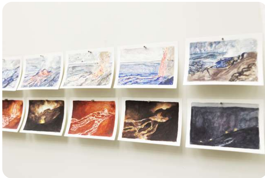
La terre qui tremble, qui hurle et qui brûle

«Une montagne immobile se fend tout à coup, s'ouvre pour verser sa lave et vomir des cendres, bombarde le paysage, gronde, tremble, fulmine. Un enfant terrible de la terre se met dans une colère noire. Mais les volcans ne sont pas en colère. Dans ce tas de cailloux et de gaz, nous voulons trouver le vivant à comprendre et à apaiser. Il n'y a personne. Le volcan monologue, nous décryptons, il n'a de bouche que pour cracher la destruction, nous prévoyons. Des lettres de Pline le Jeune aux webcams du Kilauea, on ne peut détourner le regard. D'une part, l'une des premières descriptions détaillées d'une éruption volcanique, de l'autre, le suivi en direct des états d'âme du volcan le plus actif du monde. Le temps se déploie, gradué par l'obsession, et les dessins s'accumulent. Je penche la tête au-dessus de la gueule béante. Du volcan à l'œil, de l'œil à la main, un peu de lave s'est perdue sur le papier.»