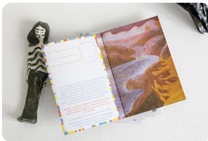
Ne rien promettre © Marion Chaix

Le projet est composé d'une bande dessinée, « Ne rien promettre », et d'une série de dessins ayant participé à la création de mon récit. « Ne rien promettre » est une bande dessinée chorale, l'histoire se déploie autour d'une dizaine de personnages. Le récit se situe dans ce qui fut autrefois une station de ski. Le réchauffement climatique a provoqué l'effondrement du glacier qui, provisoirement, met fin à la vie humaine à cette altitude. Quelques décennies plus tard, dans les années 2060, la ville est reconstruite et accueille de nouveaux habitants: ceux qui peuplent ce récit. Ce territoire montagneux a une grande influence sur la vie de ses habitants, il semble les hanter ou déterminer leurs actes. Ce récit se situe dans un espace liminaire entre le fantastique et la réalité.