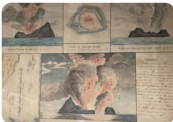
Clément Cogitore - Ferdinanda, l'île éphémère (exposition Mucem)