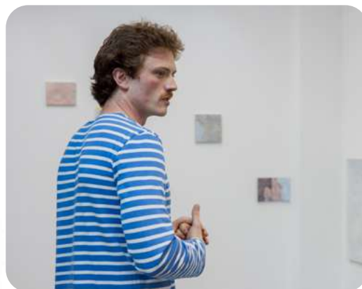
Silence en miroir

«[...] Ces portraits sont des traces de rencontres marquantes, des souvenirs fragmentés nourris par des récits intimes qui peuvent être lus à voix haute. Ma réflexion sur le manque et le temps perdu a pris forme dans un mémoire sur la personification de l'Absence dans l'Art. Lors d'une expérience de gardien de salle au Centre Pompidou, j'ai observé des instants de contemplation que j'ai traduits par la photo et le dessin. Ces scènes anonymes et silencieuses nourrissent aujourd'hui ma recherche. Je cherche à faire dialoguer visages familiers et figures anonymes à travers le dessin, le volume, la couleur et les mots, comme autant de moyens d'invocation d'une mémoire sensible.»