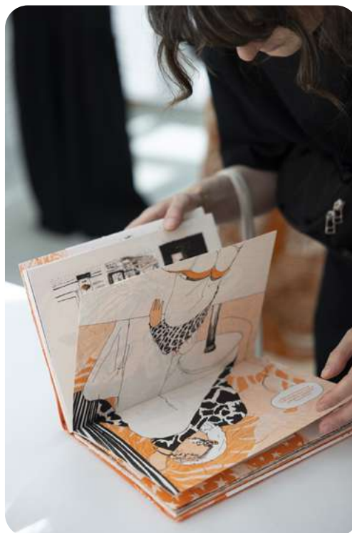
Tentative de débordement

Bienvenue à bord du vaisseau-cube, fable surréaliste aux confins du langage entre le monde des rêves et celui du réel. Au cœur de ce récit, deux personnages évoluent au sein de deux univers parallèles : l'un onirique, l'autre quasi réel. Le premier, Moeb, voyage dans un monde chaotique, expansif et silencieux. Le second, l'alter-ego, cherche par tous les moyens à s'extraire de sa réalité normée, limitée, quadrillée, où le dogme des correspondances a pris le pas sur son expérience sensible. Au travers de ces deux personnages, l'un parlant en silence tout en demeurant dans la langue onirique de la matière, et l'autre pris au piège d'un monde bavard dévoré par la production des images et des récits, le territoire du langage perdu entre les mots et les choses est questionné. Celui d'avant la voix. Celui de « l'infans » où l'on ne parle pas encore. Cet autrefois où le monde autour n'était encore que sensation, enchevêtrement de lignes, halos de lumière et rêves.