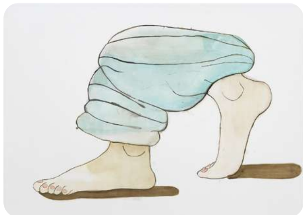
Gravita's © Christine Rebet