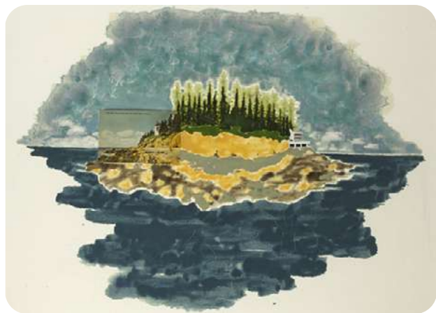
Pacific Palisades © Blaise Drummond

Blaise Drummond, peintre et graveur anglais vit et travaille dans le comté de Longford en Irlande. Sa pratique s'articule autour des concepts du monde naturel, du paysage et de sa représentation, de l'architecture et du design, et se déploie sous forme de peintures, de dessins et de sculptures/installations.