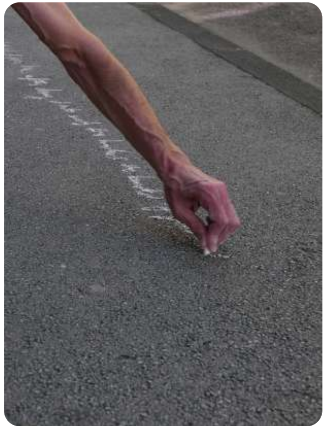
Ulysses, a long way

☀ Visite du Marégraphe de Marseille et de l'atelier Fotokino