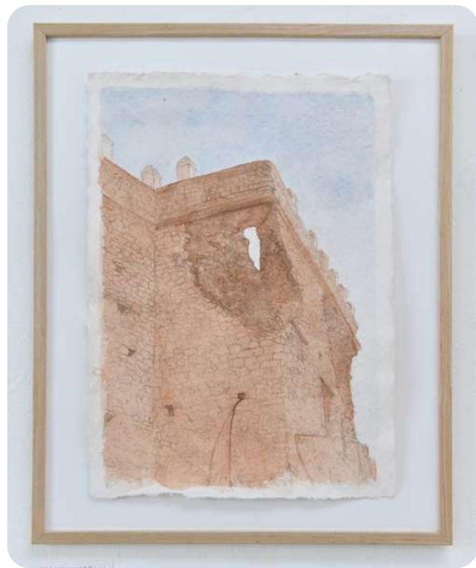
Telouet en touiza, de leurs mains renaît la kasbah