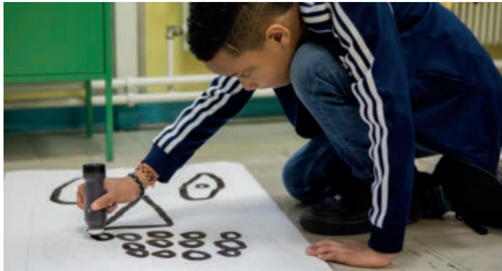
Graphisme : Atelier Eddy Terki