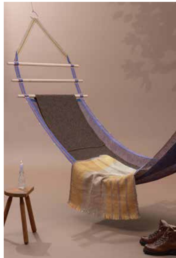
Alizé Saint-André, Itsas Mendi © Alizé Saint-André.