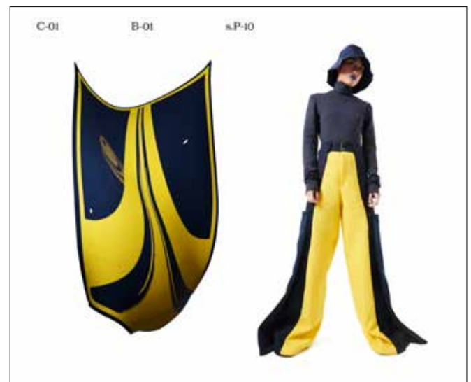
Angèle Damade, Parade

Angèle Damade a été diplômée des Arts Décoratifs de Paris en 2019, après être passée par l'école Duperré et travaille depuis pour la maison Hermès comme styliste. En parallèle, elle fonde avec Jérôme Cortie le collectif Super Facile , ayant pour but de raconter l'artisanat et les processus de création à travers l'image, la 3D et l'édition d'objets. Pour 100% L'EXPO, le collectif a travaillé avec Clara Aboulker, jeune graphiste diplômée de L'ecal - école cantonale d'art de Lausanne, sur l'image de la collection de diplôme d'Angèle : Parade . Ce projet raconte et célèbre la structure des vêtements et leurs patronages, grâce aux codes graphiques et colorés de la parade militaire.