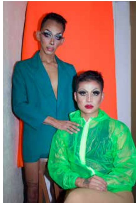
Des fictions synthétiques, Les Êtres de demain

Né à Montpellier en 1994, Gaël Sillère vit et travaille entre Montpellier et Mexico. Il est diplômé en 2019 avec félicitations de l'École nationale supérieure de Photographie (ENSP) d'Arles. Son travail prend la forme d'images, de vidéos, de performances mais également d'objets et passe toujours en amont par le dessin pour préparer chaque intervention plastique. Gaël Sillère puise dans l'immense production de la culture de masse pour imaginer des actions à caractères absurdes et poétiques. Attaché aux formes de la narration, il tente de faire advenir des micro fictions dans ces espaces uniformes et lisses.