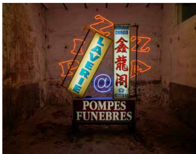
La Funèbre Laverie chinoise devenue pizzeria © Prosper Legault / La totale studio Orta.

Né en 1994 à Bordeaux, Prosper Legault vit et travaille à Saint-Ouen. Il est diplômé des Beaux-Arts de Paris en 2020. Prosper Legault assemble avec une formidable inventivité critique les fragments urbains qu'il collecte au long de ses dérives dans Paris. Témoignage joyeux des anomalies de notre société, son travail propose une relecture du réel en mêlant des matériaux hétéroclites et des objets disparates.