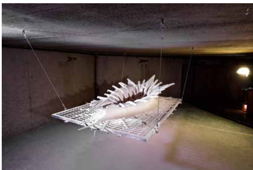
Wonder_plexus solaire