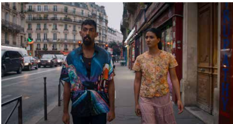
The Loyal Man © Lawrence Valin

Lawrence Valin a intégré le programme La Résidence de La Fémis et réalisé le court métrage Little Jaffna , pour lequel il reçoit le Prix Canal + au festival de Clermont-Ferrand en 2018. L'année suivante, il réalise The Loyal Man , un moyen métrage qui est également sélectionné au festival de Clermont-Ferrand en compétition nationale et internationale et pour lequel il reçoit le prix d'interprétation du meilleur comédien. Depuis, il se concentre sur l'écriture de son premier long métrage, Little Jaffna x Eelam , un film d'infiltration dans la mafia tamoule de Paris.