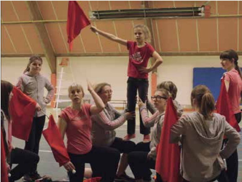
Les Amours vertes