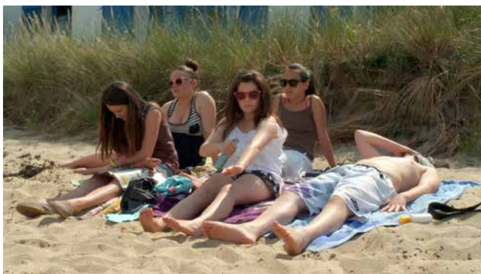
Comme une grande