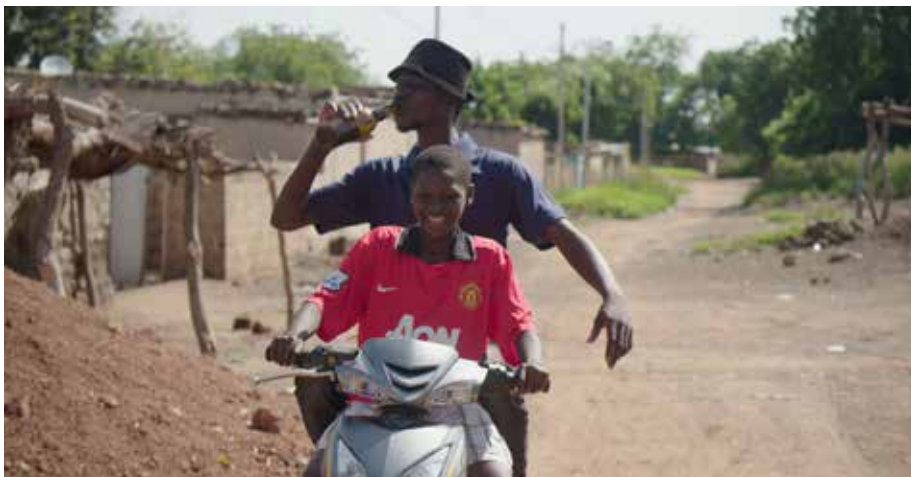
Le Caïman de Boromo