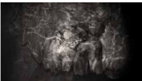
An excavation of us © Shirley Bruno