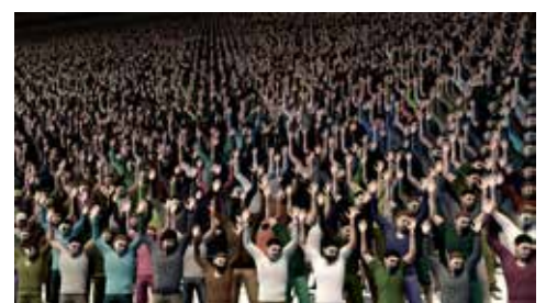
This means more , 2019 © Nicolas Gourault

Nicolas Gourault vit et travaille à Paris. Après une formation à l'École Nationale Supérieure d'Arts de Paris-Cergy (ENSAPC), et à l'École des Hautes Études en Sciences Sociales (EHESS), il poursuit actuellement sa pratique au Fresnoy (promotion André S. Labarthe 2018-2020). Par le détournement d'outils de création d'images, Nicolas Gourault explore les formes d'altérité qui résistent dans des espaces contrôlés où l'imprévu semble exclu. Son travail cherche à créer des ponts entre technique et politique à travers un usage documentaire et critique des nouveaux médias.