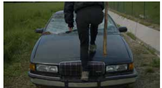
Junkyard ©Felix Luque & Iñigo Bilbao

Le travail de Félix Luque et Iñigo Bilbao interroge la manière de concevoir notre rapport à la technologie ainsi que les enjeux contemporains du développement de l'intelligence artificielle et de l'automatisation. À partir de l'utilisation combinée de systèmes de représentations électroniques et digitales, de sculptures mécatroniques, de compositions sonores génératives, de flux de données en temps réel et de processus algorithmiques, les procédés narratifs sur lesquels reposent ses installations entremêlent fiction et réalité et préfigurent les scénarios possibles d'un futur proche. (Texte de Pau Waelder)