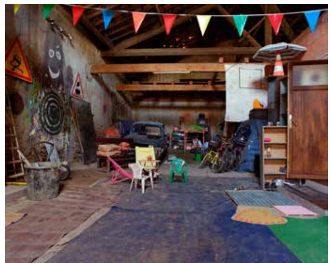
Broken Houses

Né en 1991, Vincent Marcq vit et travaille à Paris. En 2016, il sort diplômé de l'École nationale supérieure de la Photographie d'Arles. Dans son travail artistique, il aborde la relation étroite qu'entretiennent l'art et l'architecture à travers des projets qui interrogent notre manière d'habiter. Son travail tend à déconstruire avec humour ce qui fait "habiter aujourd'hui" afin de repenser nos espaces et de réfléchir à un "habiter autrement" par l'intermédiaire de l'art.