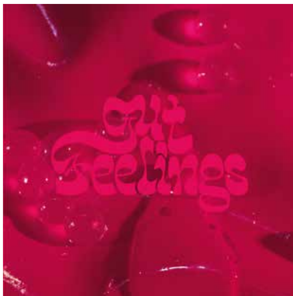
Gut Feelings © Louise Siffert,

À l'occasion de 100% L'EXPO, *Duuu Radio programme une soirée radiophonique avec projection de film autour du projet Gut Feelings de Louise Siffert, artiste diplômée des Beaux-Arts de Paris. Avec l'enregistrement sur disque vinyle d'une comédie musicale chantée et jouée par des bactéries géantes, l'artiste propose un nouveau chapitre de son projet sur la fermentation en tant que théorie vivante et palpable qui mêle corps, féminisme, et collectivité. Le motif de la fermentation devient ici une métaphore de l'activité d'une communauté micro-organique et non-genrée, à la fois humaine et non-humaine, vivante, qui bouge et change de forme.