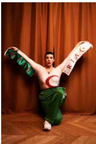
Décoloniser le dancefloor, Ari de B