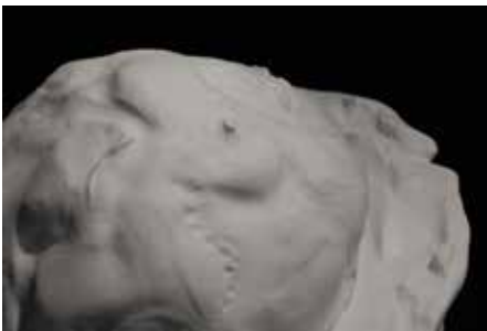
Vitamorphose , Installation, 2019 Yosra Mojtahedi