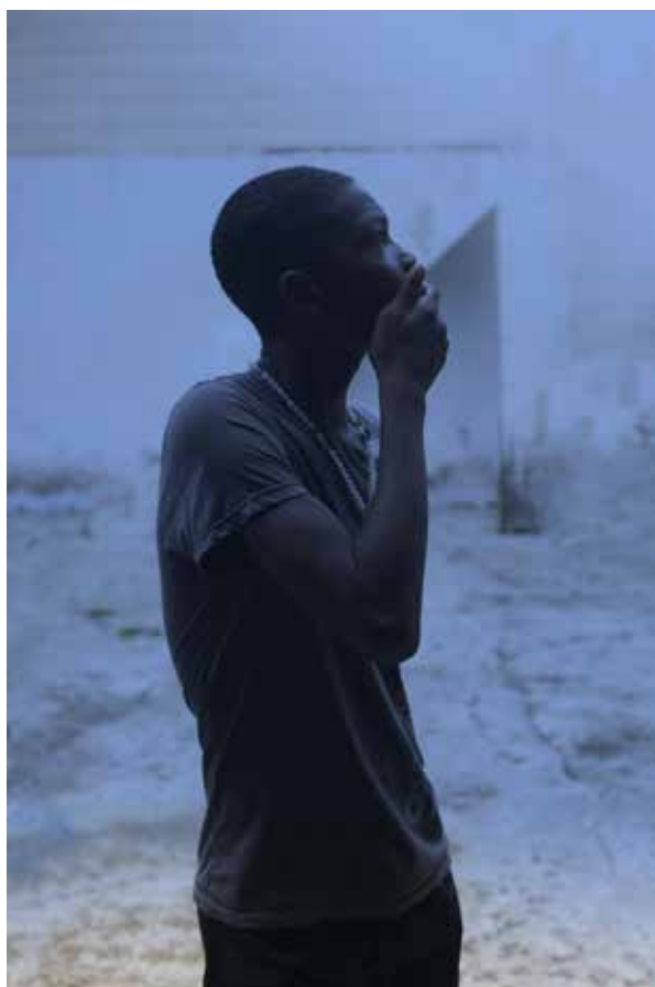
Platanos con platino © Elsa Leydier

Elsa Leydier intègre l'École nationale supérieure de la Photographie d'Arles en 2012, et en sort diplômée en 2015. Elle vit aujourd'hui entre la France et le Brésil. Elsa Leydier a été lauréate en 2019 du Prix de la Maison Ruinart/Paris Photo 2019, et l'une des lauréates du Prix Dior pour la Jeune Photographie la même année. En 2020, elle fait partie des 16 lauréats de la commande publique lancée par le CNAP en partenariat avec le Jeu de Paume. Son travail a été montré dans des expositions personnelles en Colombie, aux États-Unis, en France et aux Pays-Bas, et lors d'expositions collectives à travers le monde.