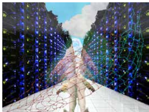
NUMIN © Eden Tinto Collins