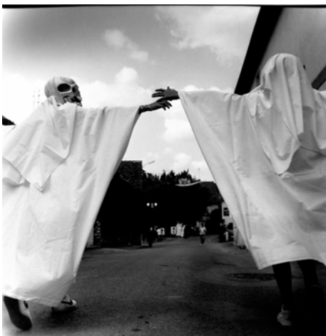
5 La « Fête des Sorciers » à Bué.