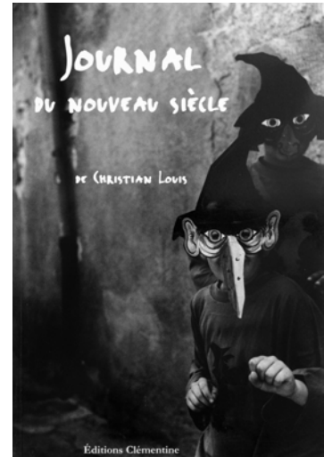
2 Journal du Nouveau Siècle , photographies et texte Christian LOUIS, Éditions Clémentine 2001.